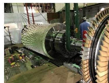
新しいガスタービンロータの吊り込み作業