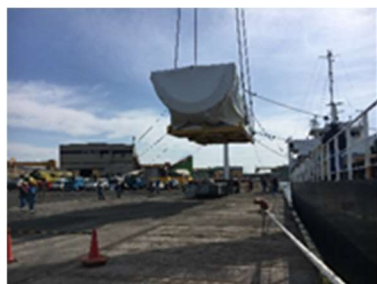
新しいガスタービン車室の水切り