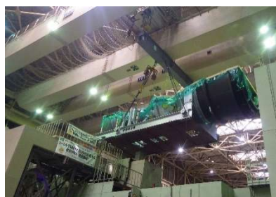
新しいガスタービン上半車室の吊り込み作業