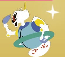
川越電力館マスコットキャラクター エナーズ

期間中 30周年仕様の華やかな館内装飾で お待ちしております★ぜひ記念撮影してね!