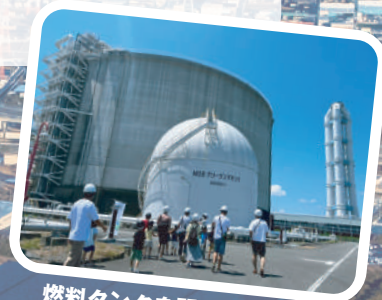
燃料タンクを間近で見よう！

開催時間 10:30～/14:00～（見学時間 約60分間） 雨天決行・荒天時中止